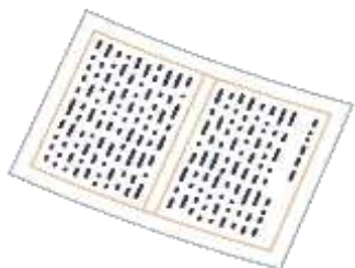
みんなの書いた 作文など