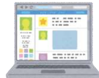
コンピュータープログラム