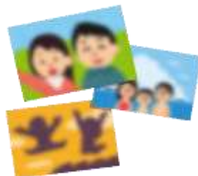
人や風景などを 撮影した写真