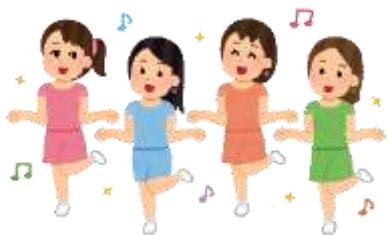
ダンスの振り付けなど