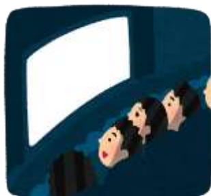
映画館で見る映画、 動画サイトにアップされている動画